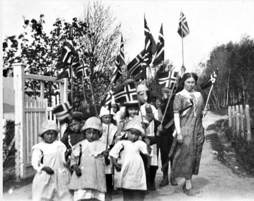
17. maifeiring på Svanviken, ca 1910